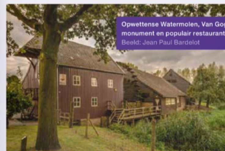
3 Opwettense Watermolen, Van Gogh monument en populair restaurant