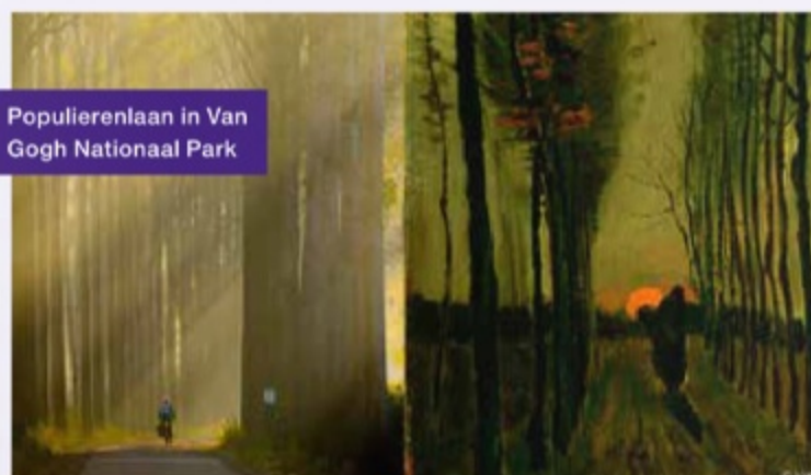
Populierenlaan in Van Gogh Nationaal Park

Populierenlaan in van Gogh Nationaal Park, Nuenen, 1884, collectie van Gogh Museum