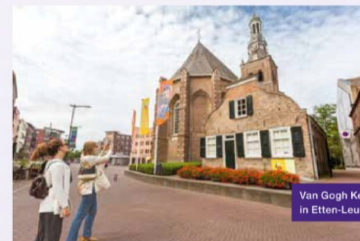
2 Van Gogh Kerk in Etten-Leur