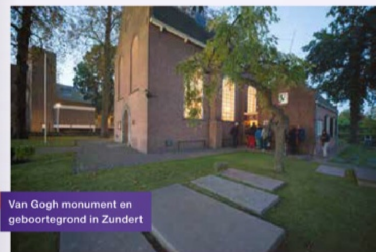
1 Van Gogh monument en geboortegrond in Zundert

De aardappeleters, Nuenen, 1885, collectie van Gogh museum