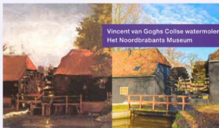
Vincent van Goghs Collse watermolen, Het Noordbrabants Museum

Populierenlaan in van Gogh Nationaal Park, Nuenen, 1884, collectie van Gogh Museum