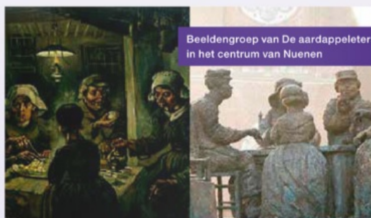
Beeldengroep van De aardappeleters in het centrum van Nuenen

Het uitgaan van de Hervormde Kerk te Nuenen, 1885, collection van Gogh Museum